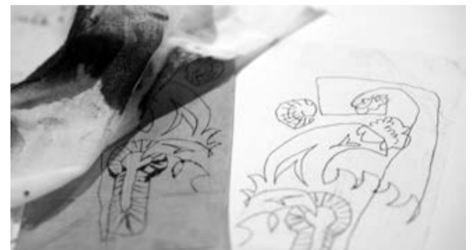
Aus dem Workshop «Experimente mit der Kaltnadel»